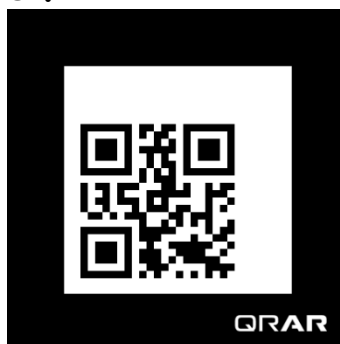
②QRAR マーク (サンプル)